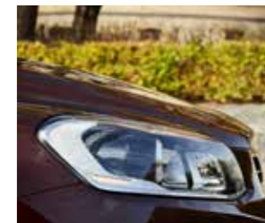
ÓTICAS E VIDROS

DANOS NÃO ACEITÁVEIS E ACEITÁVEIS EXEMPLIFICADOS.