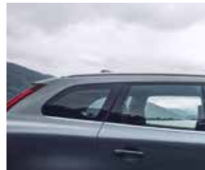
CARROCERIA E PINTURA

DANOS NÃO ACEITÁVEIS E ACEITÁVEIS EXEMPLIFICADOS.