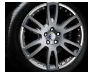
PNEUS E RODAS