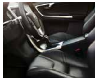
INTERIORES E COMANDOS