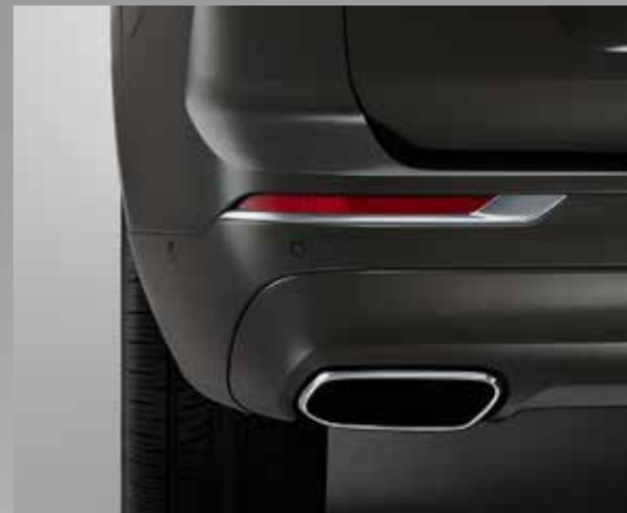
De integrerte enderørene styrker Inscription-modellens eksklusivitet og eleganse.

Vår tradisjon for innovativ sikkerhetsteknologi videreføres i nye Volvo XC60.