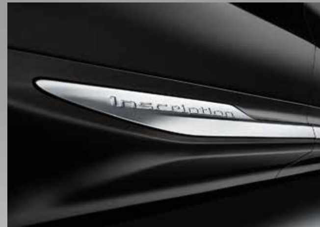
Ekte håndverk og stor vekt på detaljer kombinert med lekre naturmaterialer understreker den eksklusive skandinaviske stilen til XC60 Inscription.