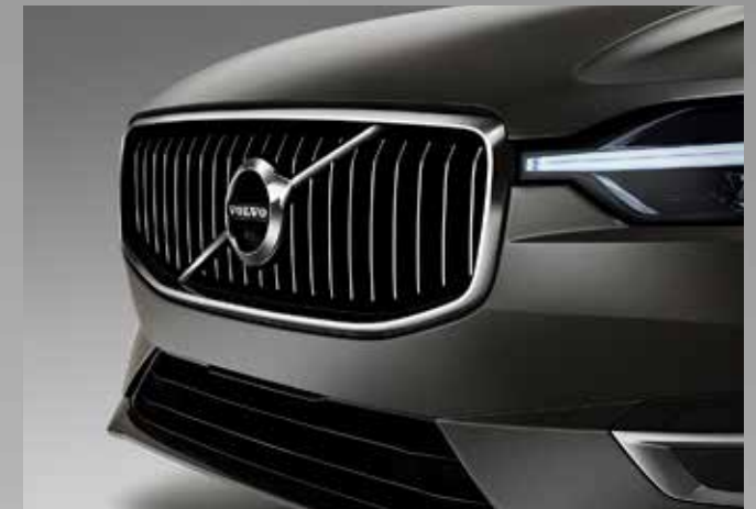
Avhengig av utstyrsnivået bidrar valget av frontgrilldesign og de nedre ytre grillene til å definere bilens karakter – her de vertikale ribbene og det blanke krommet på Inscription.